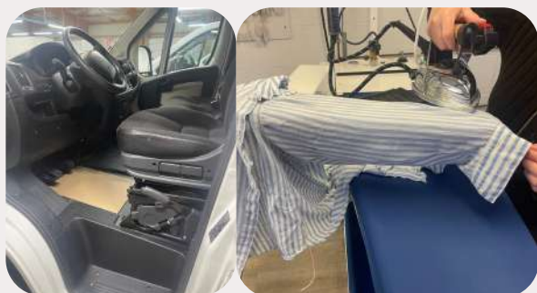
Atelier de préparation esthétique de voitures, blanchisserie et repassage