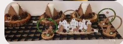
Différentes créations des usagers de l'AIT : bijoux, décorations de Noël, lingettes lavables, tableaux et bougies

De nombreuses personnes ont répondu présentes et ont pu apprécier la qualité des activités ainsi que les diverses réalisations des travailleurs proposées à la vente.