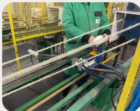
Création de longes et cordages ainsi que de cartons d'emballage pour les entreprises locales