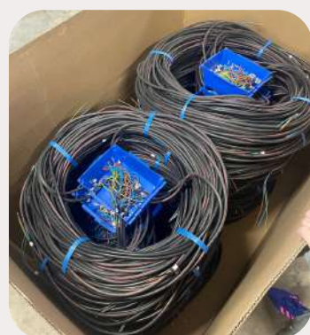
Création de pieux électriques