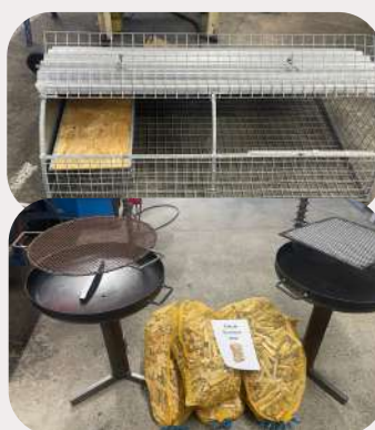
Atelier ferronnerie et métallerie : grils, barbecues, braseros, grils spéciaux pour châtaignes, serres de jardin, cages à lapins, bancs et range bûches