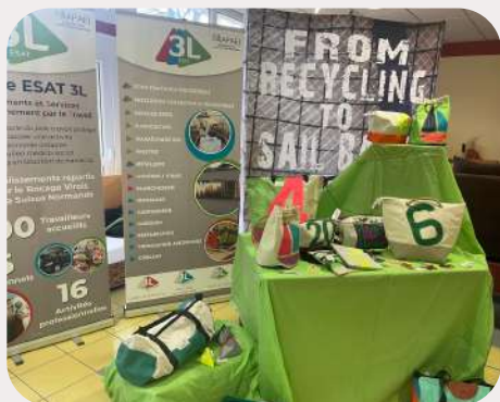
Présentation de la marque R'Bag : articles de bagagerie réalisés à partir de matériaux recyclés : les voiles de bateaux ou textiles nautiques www.rbag.fr/

Comme chaque année, nos deux ESAT de Condé et de Roullours ont ouvert leurs portes aux partenaires et familles afin d'y découvrir les différentes activités proposées :