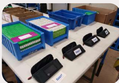
Atelier conditionnement, réalise de la sous-traitance industrielle pour les entreprises locales en accord avec le cahier des charges produit par le client.