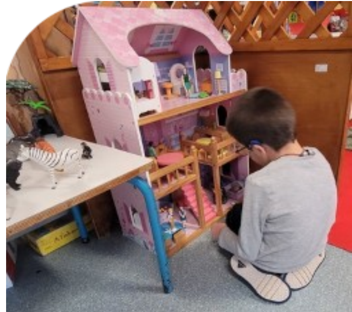
IME - Ludothèque