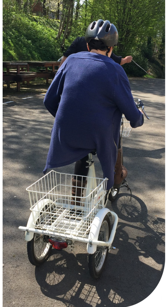
Foyer de vie – Sortie vélo

Elle fait la promotion auprès des autorités et pouvoirs publics et divers organismes locaux, pour la défense morale et matérielle, des intérêts généraux des personnes en situation de handicap et de leurs familles.