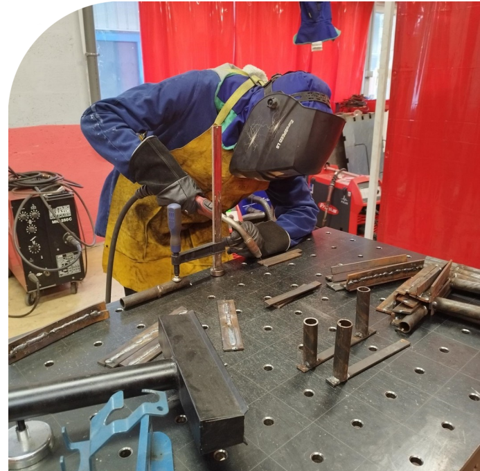
ESAT - Poste de soudeur

Les administrateurs participent à la définition de la politique associative et représentent l'Association à l'externe et à l'interne, assurent une communication à tous les échelons, afin d'établir une bonne compréhension des missions attendues, de préparer le changement, et de favoriser la sérénité dans l'exercice des missions des professionnels.