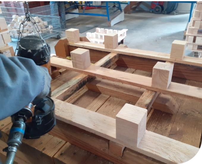
ESAT - Fabrication de palettes

Ce processus de transformation sociale s'inscrit dans un temps long, car il nécessite une révision des normes et des représentations (par exemple, en particulier au niveau de la scolarité, de l'emploi...). Il nécessite un travail pas-à-pas, répété et permettant de faire reconnaître le bénéfice sociétal de l'inclusion, pour tous :