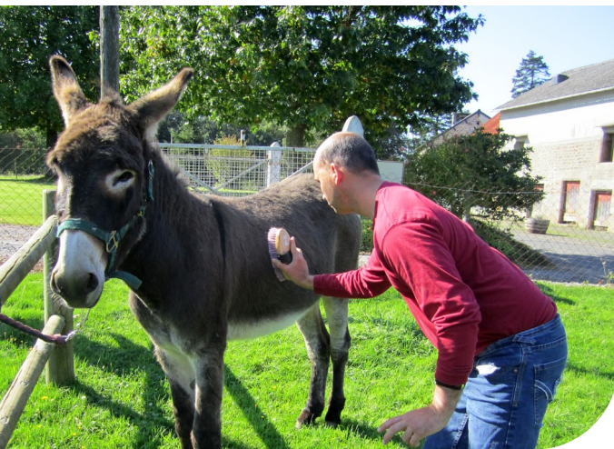
Foyer de vie – Sortie aux ânes

Pour les années à venir, les axes prioritaires de l'amélioration continue de la qualité concernent :