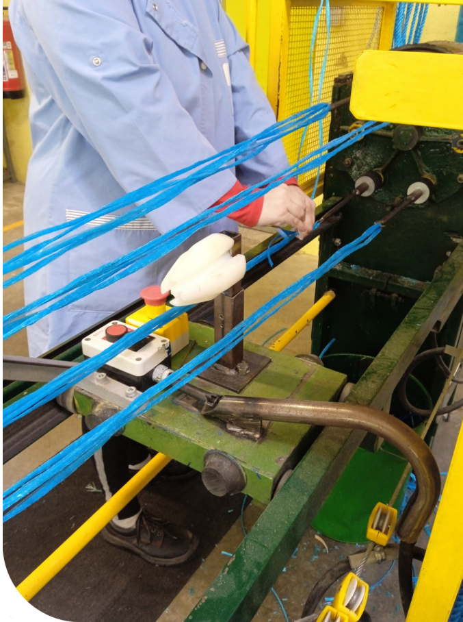
ESAT - Corderie